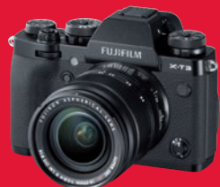
Sensation: UHD mit 50p und 10 Bit intern nimmt derzeit nur die Fujifilm X-T 3 auf.