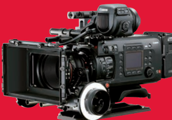
Vollformat-Kinokamera: Canon EOS C700 FF.