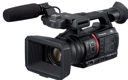
Neuester Henkel-Profi von Panasonic: AG-CX 350 E.