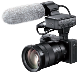
Überzeugender APS-C-Fotofilmer von Sony: Alpha 6400.