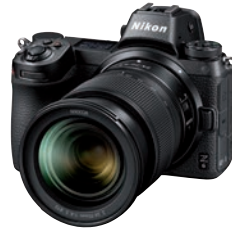
Mehr Lichtstärke durch weniger Pixel: Nikon Z6.