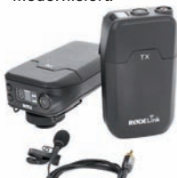
Røde bietet mit RødeLink eine günstige Funklösung.