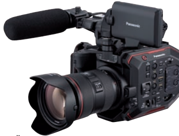
Überzeugende und günstige Kinokamera: Panasonic AU-EVA 1.