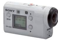
Sony's X 3000 mit BOSS-Stabilisierung schlägt auch GoPros Hero 5.