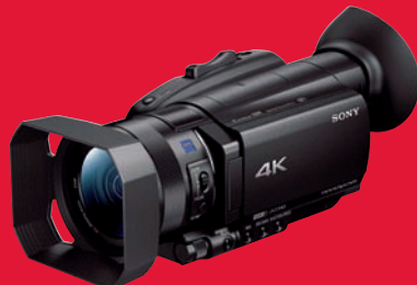
Spitzenreiter bei Consumer-Camcordern nach dem alten Testverfahren: Sony FDR-AX 700.