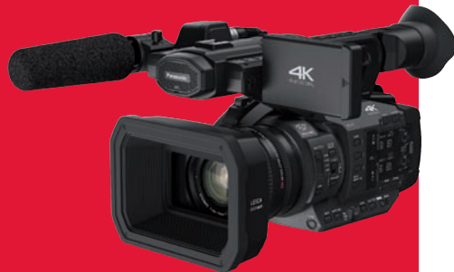
Top-Camcorder für Prosumer: Panasonic HC-X 1 mit 4K und UHD.