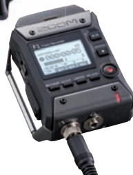
Pfiffiger Mini-Fieldrecorder: Zoom F1