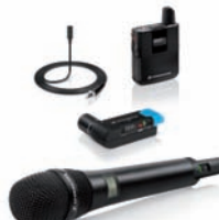
Sennheiser überzeugt mit dem fast automatisch arbeitenden AVX-Funkmikro-System.