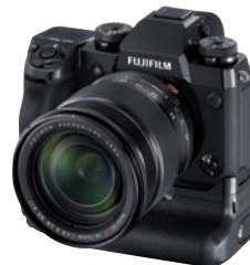
Überzeugender Einstand bei 4K-Fotofilmen: Fujifilm X-H 1.