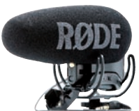
Røde hat das VideoMic Pro in der Plus-Version gut modernisiert.