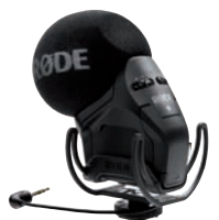
Gelungenes Update einer Legende: Røde Stereo VideoMic Pro Rycote.