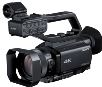
Günstiger Einsteiger-Profi: Sony PXW-Z 90 mit Ein-Zoll-Sensor.