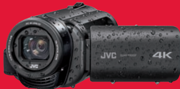
Klettert nach Korrektur auf 60 Punkte: 4K-Allwetter-Cam JVC GZ-RY 980.