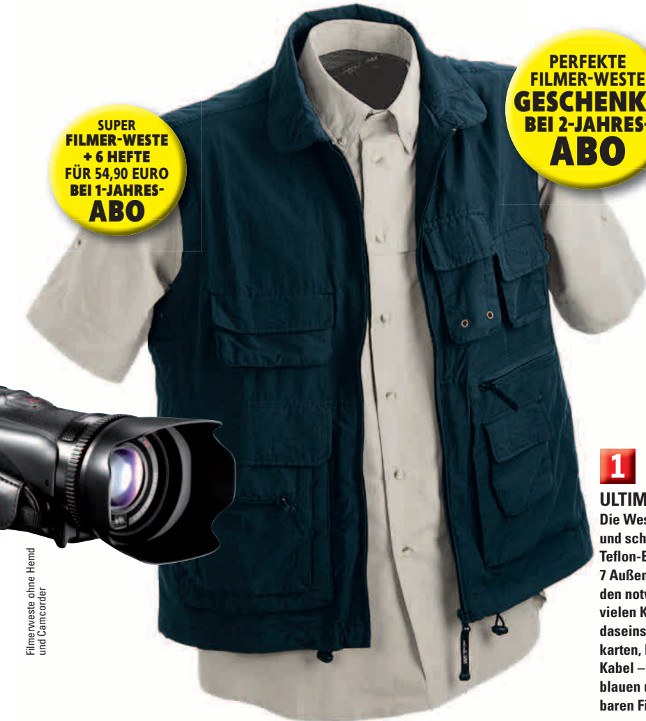
Filmerweste ohne Hemd und Camcorder

PERFEKTE FILMER-WESTE GESCHENKT BEI 2-JAHRES- ABO