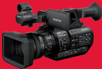
Bester kompakter Profi-Camcorder in der Bestenliste: Sony PXW-Z 280.