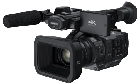
Toller 4K-Camcorder für Prosumer: Panasonic HC-X1.