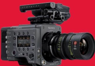
Großes Kino: Sony-Kamera Venice im Cine-Kit.