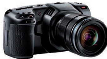
Preisbrecher: Blackmagic Pocket Cinema Camera 4K für 1399 Euro.