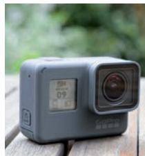
Wieder auf Platz 1: GoPro mit der Hero 7 Black.