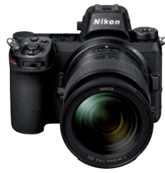
Auf Antrieb vorne mit dabei: Nikons erste spiegellose Systemkamera Z7.