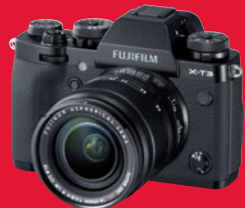
Sensation: UHD mit 50p und 10 Bit intern nimmt derzeit nur die Fujifilm X-T 3 auf.