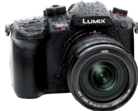
Lichtstärkste Micro-Four-Thirds-Kamera: Panasonic Lumix DC-GH5 S.