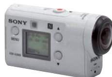
Sonys X 3000 mit BOSS-Stabilisator: Harte Konkurrenz für GoPro Hero 7 Black.