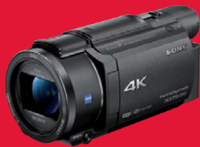
Toller Bildstabilisator und 4K-Videos im UHD-Format: Sony FDR-AX 53.

Diese Camcorder haben uns bei den Tests zuletzt am meisten beeindruckt: