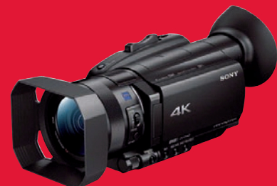
Neuer Spitzenreiter bei Consumer-Camcordern: Sony FDR-AX 700.