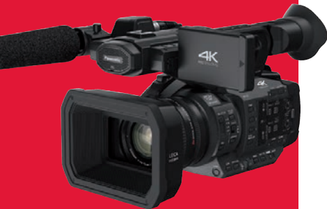
Top-Camcorder für Prosumer: Panasonic HC-X 1 mit 4K und UHD.