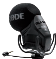
Gelungenes Update einer Legende: Røde Stereo VideoMic Pro Rycote.