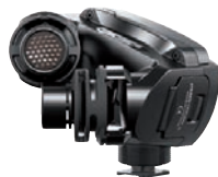
Absolute Referenz für Stereomikrofone: Røde Stereo VideoMic X.