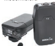
Røde bietet mit RødeLink eine günstige Funklösung.