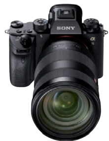
Aktuelle Nummer 1 für Foto-Filmer: die Sony Alpha 9.