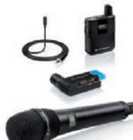
Sennheiser überzeugt mit dem fast automatisch arbeitenden AVX-Funkmikro-System.