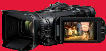
Gelungener 4K-Einstand: Canons Legria GX 10 erobert Platz 2 der Bestenliste.