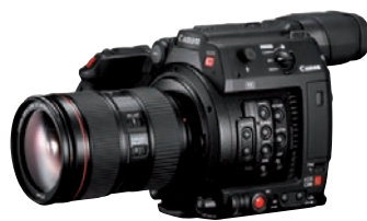
Raw-Camcorder für relativ wenig Geld: Canon C200.