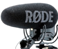
Røde hat das VideoMic Pro in der Plus-Version gut modernisiert.