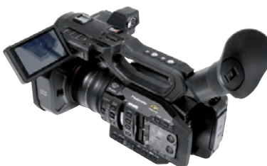
Einer der besten 4K-Kompaktprofilis derzeit: Panasonic AG-UX 180.