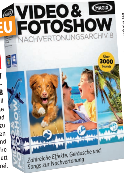
FOTO & VIDEOSHOW NACHVERTONUNGS-ARCHIV 8

Über 3.000 professionell produzierte Sounds, realistische Effekte, Atmosphären und stimmungsvolle Musikstücke zu den verschiedensten Themen sorgen bei Ihren Videos und Fotoshows für unvergessliche Momente. Natürlich komplett GEMA- und lizenzfrei.