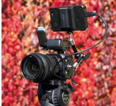
Kinokamera im Mini-Format: Sony ILME-FX 3.

1 Listenpreis in Euro *Urteil für den Einsatz als HD-Camcorder www.videoaktiv.de 1/2022