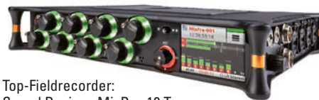
Top-Fieldrecorder: Sound Devices MixPre-10 T