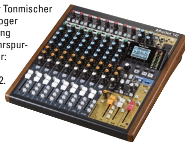
Digitaler Tonmischer mit analoger Bedienung und Mehrspur-Recorder: Tascam Model 12.