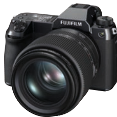
Mit Mittelformat im DSLR-Design an die Spitze: Fujifilm GFX100S.