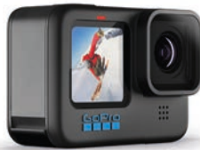
Knapp vorne bei Actioncams: GoPro Hero 10 Black.