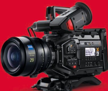
Blackmagic präsentiert mit der Ursa Mini Pro die erste 12K-Filmkamera.