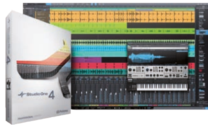
Studio One Professional von PreSonus gehört zur Spitze der Recording-Sequencer.

1 Listenpreis in Euro 2 Download-Preis **US-Dollar