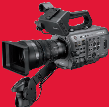
Neuer Star bei den UHD-Profikameras: die Sony PXW-FX 9.