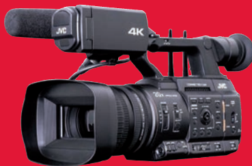
Proficamcorder mit ausgefeilten Streaming-Funktionen: JVC GY-HC 550.