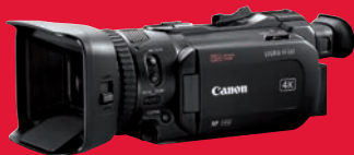
Top bei Consumer-4K-Camcordern: Canon Legria HF G60 in UHD.

Diese Filmkameras haben uns bei den Tests zuletzt am meisten beeindruckt: