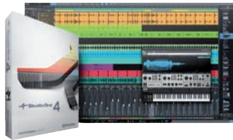
Studio One von PreSonus in Version 4.6 Professional gehört zur Spitze der Recording-Sequencer.

1 Listenpreis in Euro *Download-Preis **US-Dollar