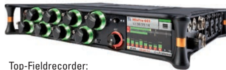
Top-Fieldrecorder: Sound Devices MixPre-10 T