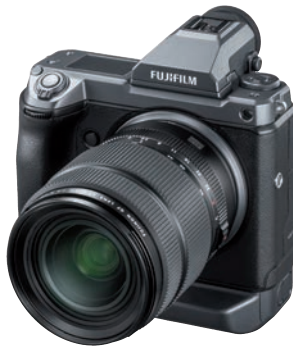
4K-Videos im Mittelformat: Fujifilm GFX100 mit 100-MB-Sensor.