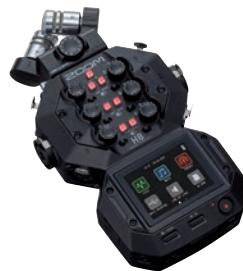
Neues Spitzenmodell bei handlichen Mobilrecordern: Zoom H8.