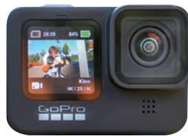
Spitzenplatz verteidigt: Actioncam GoPro Hero 9 Black.