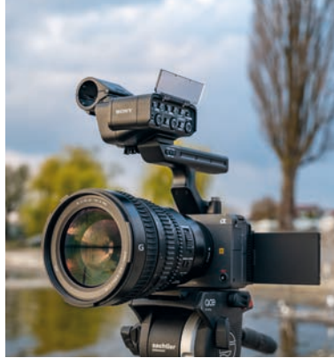
Kinokame im Mini-Format: Sony ILME-FX 3.

1 Listenpreis in Euro 2 Urteil für den Einsatz als HD-Camcorder www.videoaktiv.de 6/2021