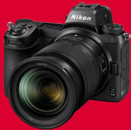
Nikons Vollformat-Kamera Z 6II hat sogar die teurere Z 7II geschlagen.