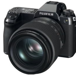
Mit Mittelformat im DSLR-Design an die Spitze: Fujifilm GFX100S.