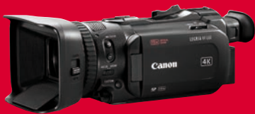
Top bei Consumer-4K-Camcordern: Canon Legria HF G60 in UHD.

Diese Filmkameras haben uns bei den Tests zuletzt am meisten beeindruckt: