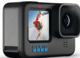
Knapp vorne bei Actioncams: GoPro Hero 10 Black.