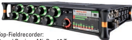
Top-Fieldrecorder: Sound Devices MixPre-10 T

1 Listenpreis in Euro * ohne Mehrwertsteuer