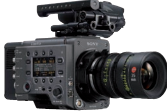
Großes Kino: Sony Venice im Cine-Kit.