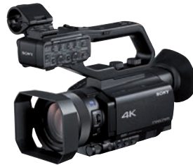
Überraschend gut: Mini-Profii HXR-NX 80 von Sony.