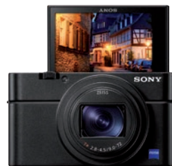
Sehr gute UHD-Videoqualität: Sony Cybershot DSC-RX100 VI.