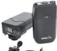
Røde bietet mit RødeLink eine günstige Funklösung.