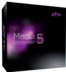
Für Mac- wie PC-Editing: Profi-Software „Avid Media Composer 5“.