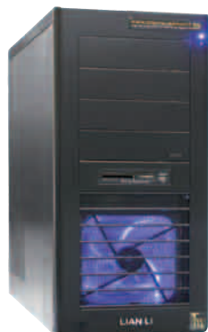
Bester Schnitt-PC: MagicMax HD von Magic Multi Media mit „Edius 5.5“.