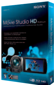
Exzellent für AVCHD: das „Vegas Movie Studio HD 10 Platinum“ von Sony für nur 70 Euro.