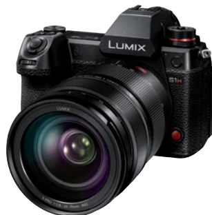
Neue Nummer 1 bei Vollformat-Kameras: Panasonic Lumix DC-S 1 H.