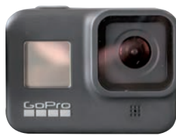
Wieder auf Platz 1: Actioncam GoPro Hero 8 Black.