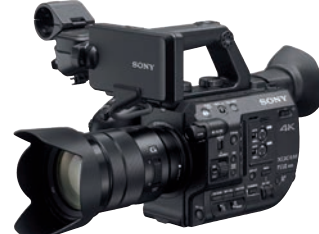
Noch besser als der Vorgänger: Sony PXW-FS 5 II: