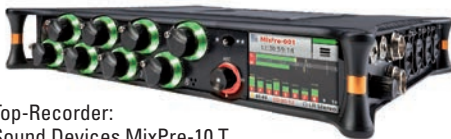
Top-Recorder: Sound Devices MixPre-10 T

1 Listenpreis in Euro *ohne Mehrwertsteuer