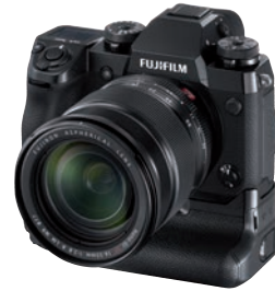
Überzeugender Einstand bei 4K-Foto-Filmern: Fujifilm X-H 1.