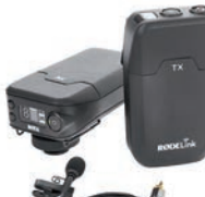
Røde bietet mit RødeLink eine günstige Funklösung.