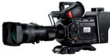
Günstiger Schultercamcorder für TV: Blackmagic Ursa Broadcast.