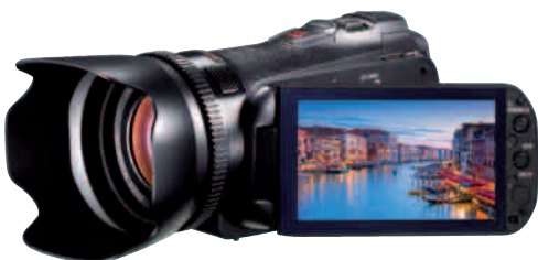
Spitzenklasse: das neue Canon-Topmodell der Konsumentliga, der Legria HF G 10 für rund 1500 Euro.