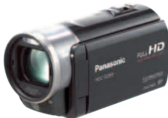
Kauf Tipp: Im Test der neuen HD-Mittelklasse (Seite 14) hielt der Panasonic SD 99 als günstigster Cam gut mit.