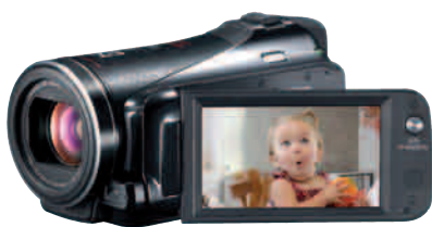
König der Nacht: Der Legria HF M 41 von Canon ist der lichtstärkste HD-Camcorder seit langem und bester Allrounder.

Außerdem finden Sie dort Testbilder und sogar Testvideos zu den neuen Kameras. Die VIDEOAKTIV-Camcorder-Datenbank hilft Ihnen bestimmt weiter, wenn Sie Digital-Cams mit speziellen Funktionen oder in bestimmten Preisklassen suchen: www.videoaktiv.de/camcorder-test