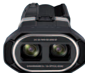
Doppel-3D: Der JVC GS-TD 1 beherrscht beide 3D-Verfahren – Side by side und MVC. Die komplette 3D-Punktwertung finden Sie auf www.videoaktiv.de/51113