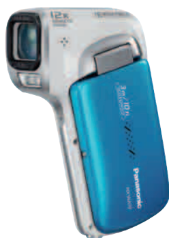
Strandtauglich: Mit dem neuen Outdoor-Cam WA 10 von Panasonic kann man getrost baden gehen.