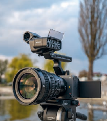
Kinokamera im Mini-Format: Sony ILME-FX 3.

¹Listenpreis in Euro *Urteil für den Einsatz als HD-Camcorder