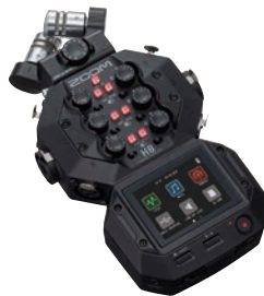
Neues Spitzenmodell bei handlichen Mobilrecordern: Zoom H8.