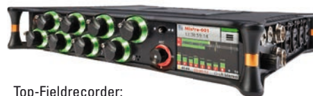
Top-Fieldrecorder: Sound Devices MixPre-10 T