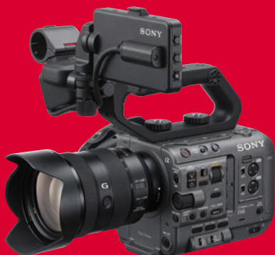
Sony macht digitale Kinoproduktion erschwinglich mit der FX 6.