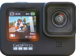
Spitzenplatz verteidigt: Actioncam GoPro Hero 9 Black.