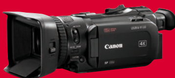
Top bei Consumer-4K-Camcordern: Canon Legria HF G60 in UHD.

Diese Filmkameras haben uns bei den Tests zuletzt am meisten beeindruckt: