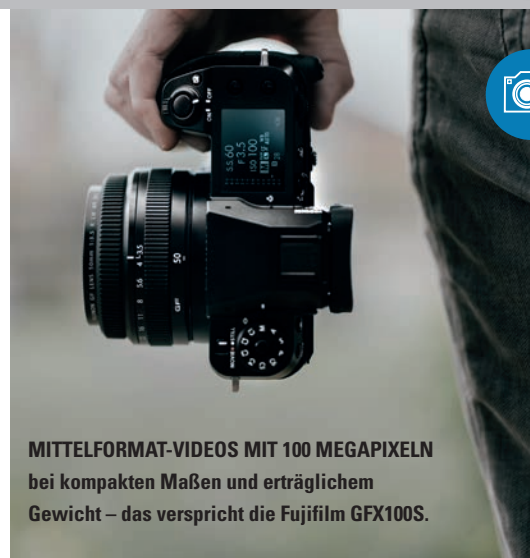
MITTELFORMAT-VIDEOS MIT 100 MEGAPIXELN bei kompakten Maßen und erträglichem Gewicht – das verspricht die Fujifilm GFX100S.