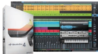
Studio One Professional von PreSonus gehört zur Spitze der Recording-Sequencer.

¹Listenpreis in Euro *Download-Preis **US-Dollar