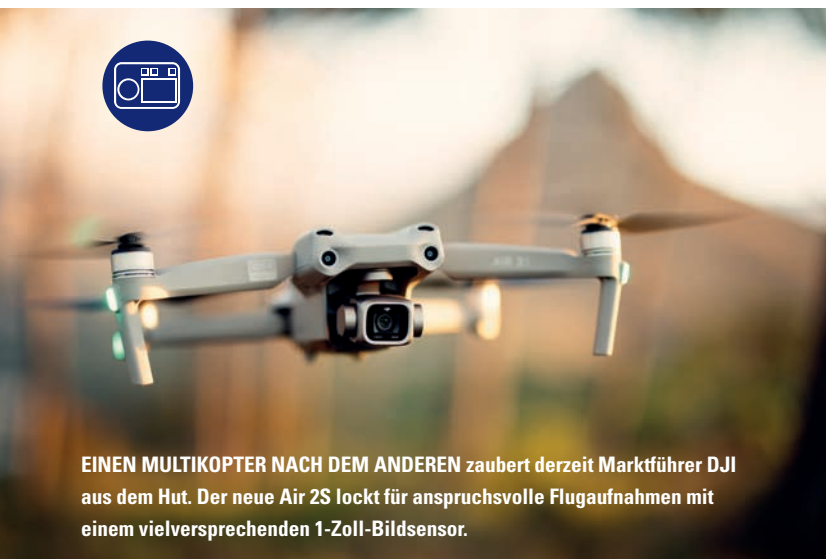
EINEN MULTIKOPTER NACH DEM ANDEREN zaubert derzeit Marktführer DJI aus dem Hut. Der neue Air 2S lockt für anspruchsvolle Flugaufnahmen mit einem vielversprechenden 1-Zoll-Bildsensor.