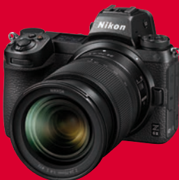
Nikons Vollformat-Kamera Z 6II hat sogar die teurere Z 7II geschlagen.