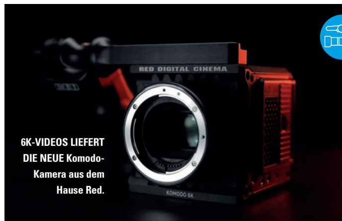
6K-VIDEOS LIEFERT DIE NEUE Komodo-Kamera aus dem Hause Red.