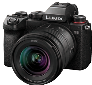
Spitzenreiter der filmenden Fotokameras nach altem Testverfahren: Panasonic Lumix DC-S 5.