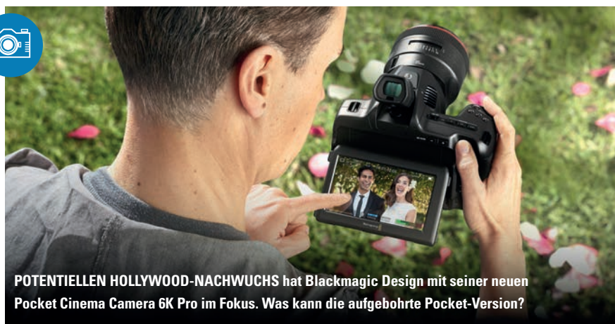
POTENTIELLEN HOLLYWOOD-NACHWUCHS hat Blackmagic Design mit seiner neuen Pocket Cinema Camera 6K Pro im Fokus. Was kann die aufgebohrte Pocket-Version?