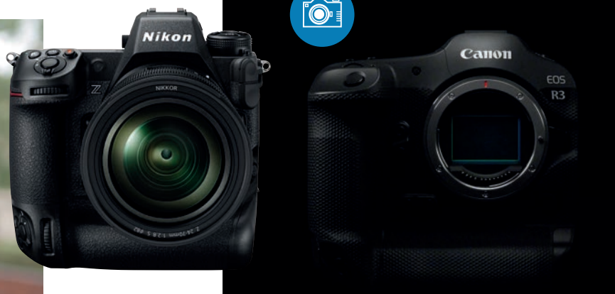
DIE ENTWICKLUNG NEUER TOPMODELLE ihrer Systemkamera-Linien haben Canon und Nikon angekündigt. Man darf gespannt sein, was Nikons Z 9 und Canons R3 fürs Filmemachen zu bieten haben. Wir wagen einen Blick hinter die Kulissen.