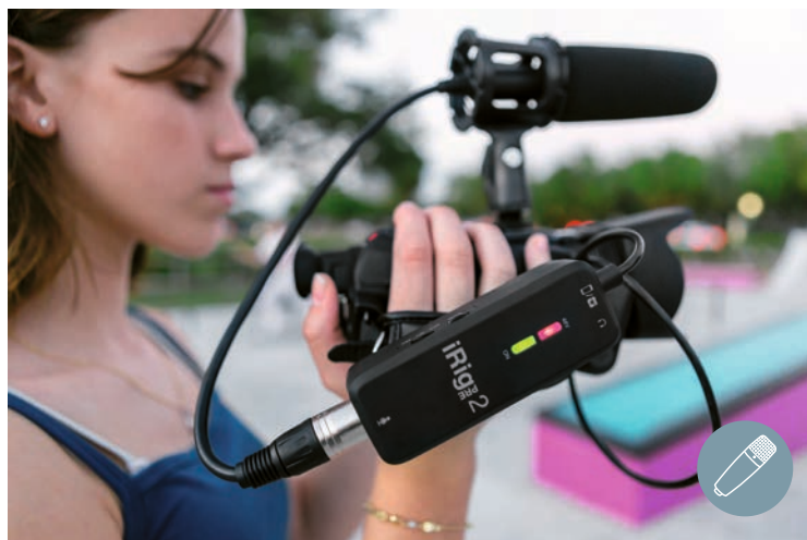
XLR-MIKROFONE AN MINIKLINKEN-KAMERAS adaptiert der Vorverstärker iRig Pre 2 – Phantomspeisung inklusive.