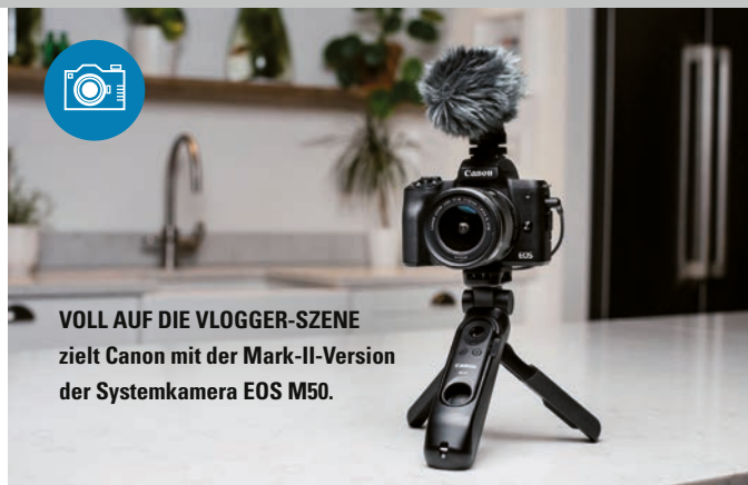
VOLL AUF DIE VLOGGER-SZENE zielt Canon mit der Mark-II-Version der Systemkamera EOS M50.