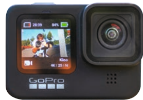
Spitzenplatz verteidigt: Actioncam GoPro Hero 9 Black.