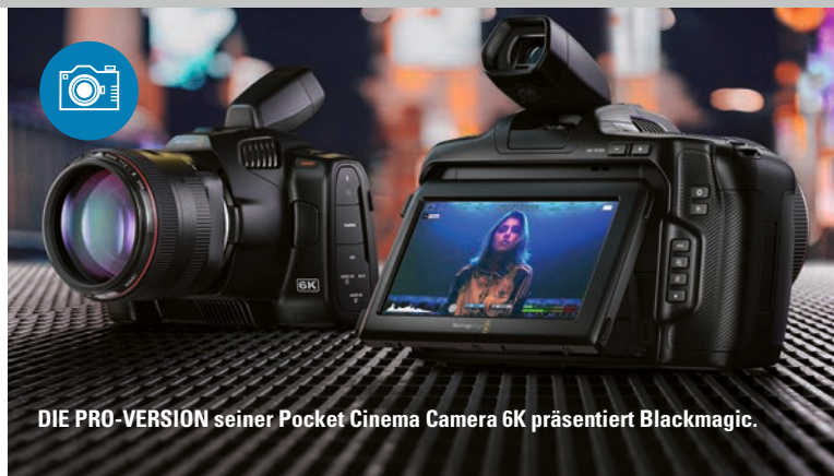
DIE PRO-VERSION seiner Pocket Cinema Camera 6K präsentiert Blackmagic.