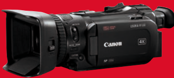
Top bei Consumer-4K-Camcordern: Canon Legria HF G60 in UHD.

Diese Filmkameras haben uns bei den Tests zuletzt am meisten beeindruckt: