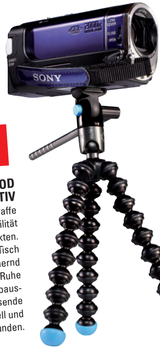
Lieferung ohne Camcorder

Der ultimative Stativklammeraffe für Camcorder sorgt für Flexibilität bei den Aufnahmestandpunkten. Ob als Ministativ auf dem Tisch oder ein Gelände umklammernd - der GorillaPod sorgt für Ruhe im Bild und dank der Videoausführung ist auch der passende Bildausschnitt schnell und bequem gefunden.