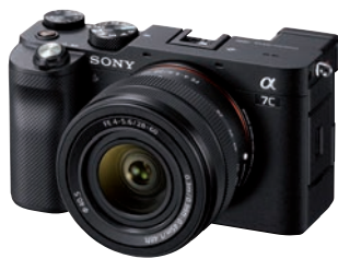
Klein, aber mit exzellenter Videoqualität: Sony Alpha 7C mit Vollformat-Sensor.