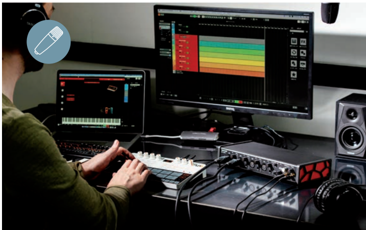
AUDIOINTERFACES FÜR DIE NACHVERTONUNG werden immer besser und erschwinglicher. Im Test: Neuheiten von Tascam (oben), SSL, Focusrite & Co.