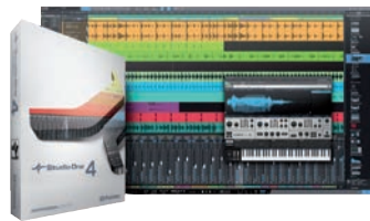
Studio One Professional von PreSonus gehört zur Spitze der Recording-Sequencer.

1 Listenpreis in Euro 2 Download-Preis **US-Dollar