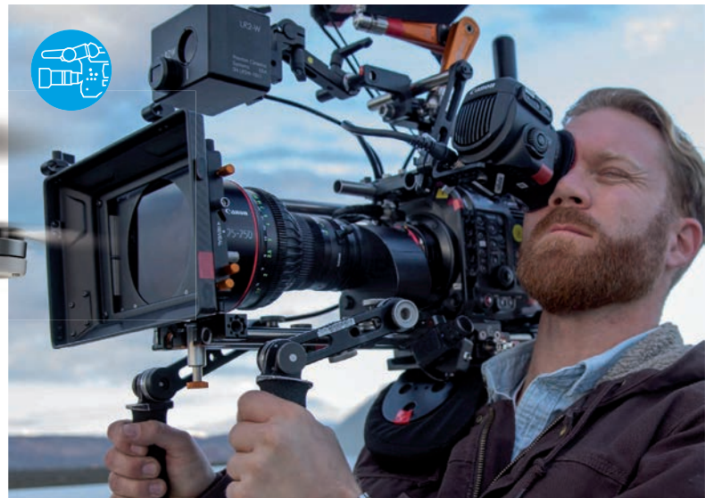
CANON WILL GEWOHNTES TERRAIN IM PROFIKAMERA-MARKT verteidigen – unter anderem mit der EOS C300 Mark III.