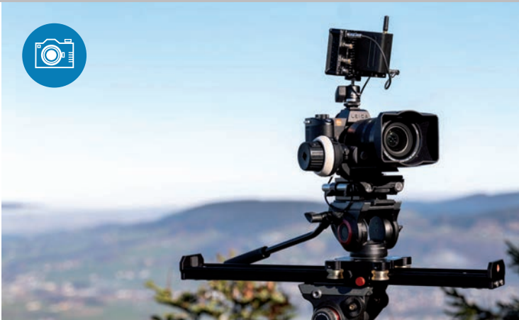
LEICA MELDET SICH ZURÜCK IM FILMER-MARKT mit der S-Version der Systemkamera SL2, die jetzt sogar in 4K mit 50 Vollbildern filmt.