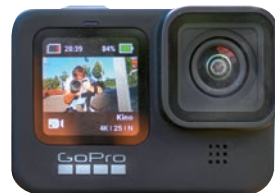
Spitzenplatz verteidigt: Actioncam GoPro Hero 9 Black.