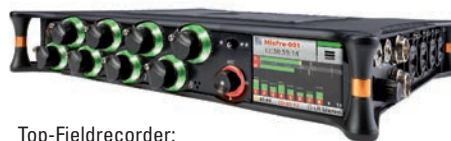
Top-Fieldrecorder: Sound Devices MixPre-10 T