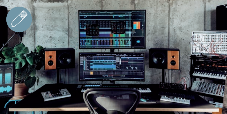
STEINBERGS CUBASE IST EINES DER BEKANNTESTEN Recording-Programme für PC wie Mac. Wir testen, was es bei Nachvertonung und Audio-Postproduktion kann.