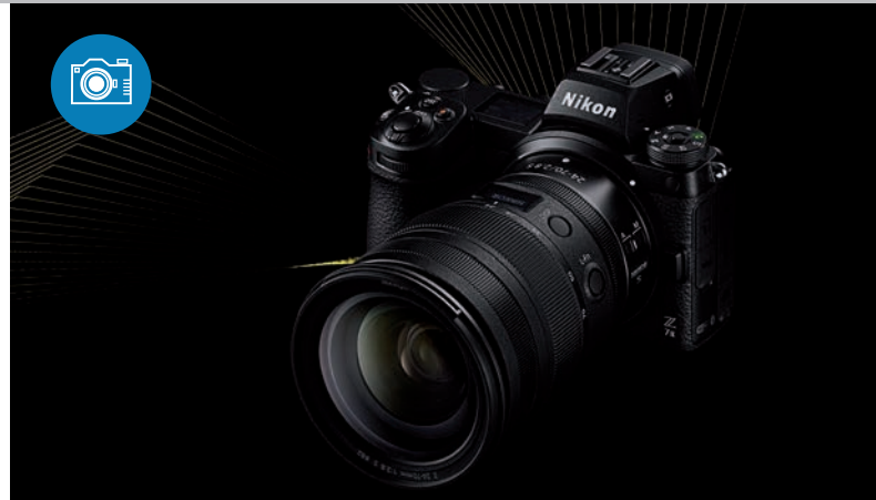
NIKON HAT DIE ZWEITE GENERATION seiner spiegellosen Systemkameras am Start, nämlich die Z 7 II (oben) und die für Filmer optimierte, lichtstarke Z 6 II.