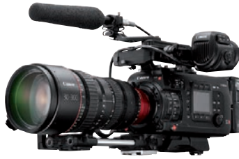
Die neue Nummer 1 unserer Bestenliste für Profi-Camcorder: Canon C700.