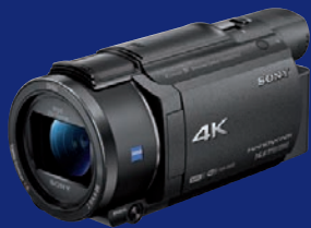
Toller Bildstabilisator und 4K-Videos im UHD-Format: Sony FDR-AX 53.

Diese Camcorder haben uns bei den Tests zuletzt am meisten beeindruckt: