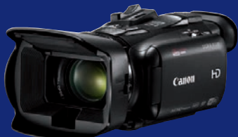
Full-HD-Camcorder für kreative Prosumer: Canon Legria HF G40.