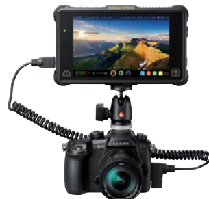
Beste MFT-Systemkamera für Filmer: Panasonic Lumix DC-GH 5.