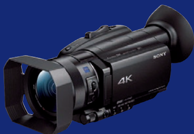
Neuer Spitzenreiter bei Consumer-Camcordern: Sony FDR-AX 700.