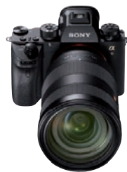
Aktuelle Nummer 1 für Foto-Filmer: die Sony Alpha 9.