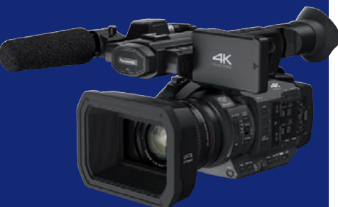
Top-Camcorder für Prosumer: Panasonic HC-X 1 mit 4K und UHD.